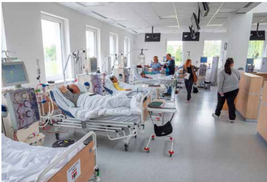
► Hemodialyzační středisko.

Moderní prostory a výrazně větší komfort péče mají nově k dispozici pacienti se závažnou poruchou funkce ledvin, kteří musejí několikrát týdně navštěvovat přístrojovou dialýzu v Kroměřížské nemocnici.