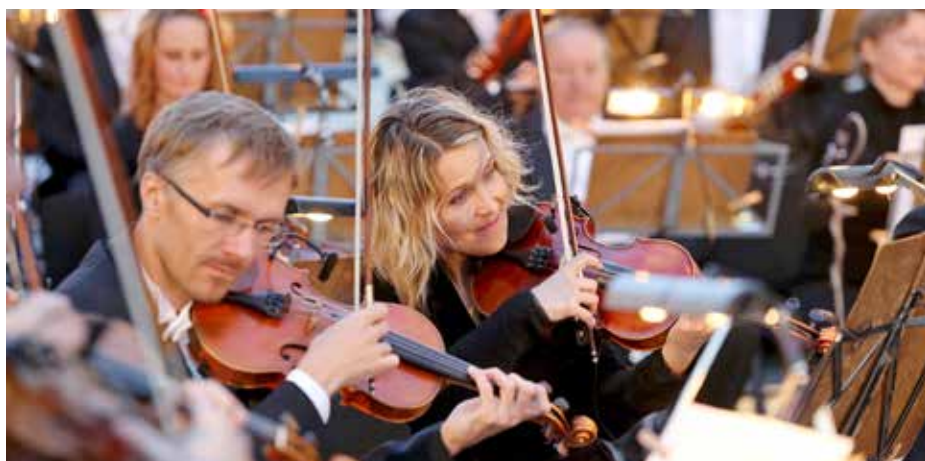
► Oblíbené koncerty filharmonie pod širým nebem začaly již v roce 2015.