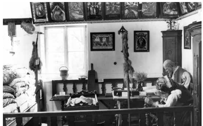
► Interiér muzea v roce 1943.

Lázeňské město Luhačovice je známé úzkými vztahy se slovenskou kulturou. Narodovci