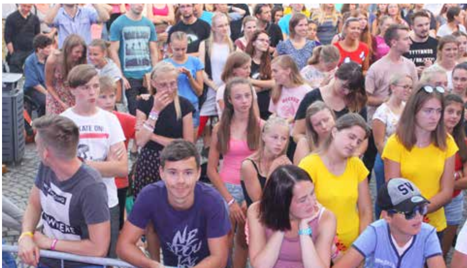
► Festival UNITED tradičně láká do Vsetína.