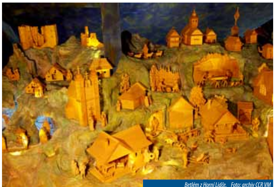
Betlém z Horní Lideče.