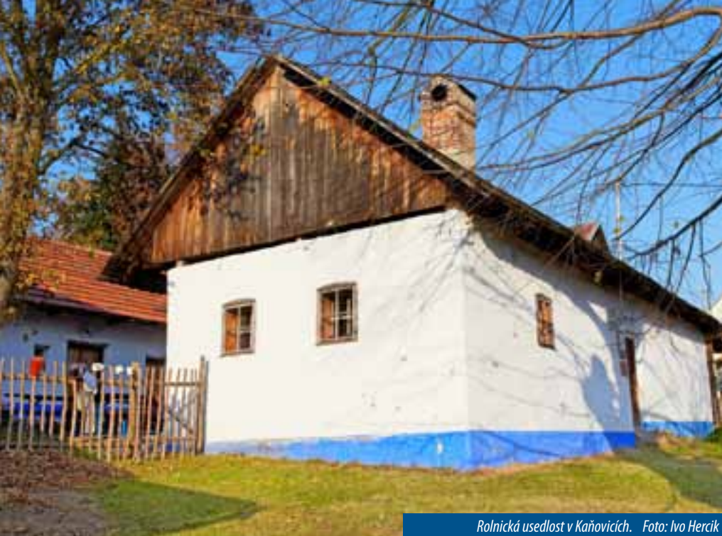
Rolnická usedlost v Kaňovicích.