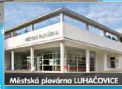
Městská plovárna LUHAČOVICE

Srdečně Vám tímto děkujeme za spolupráci a přízeň v roce 2011