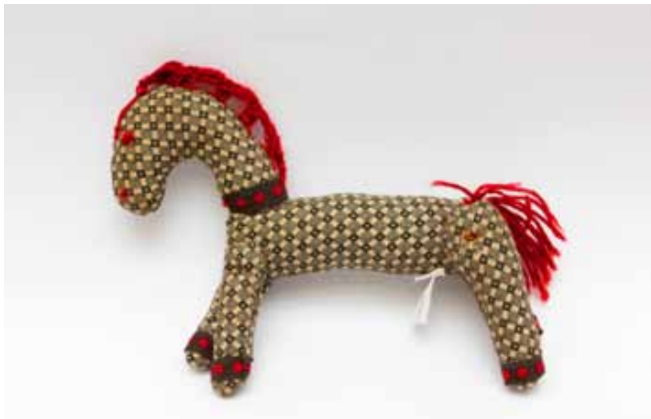
Jeden z exponátů výstavy hraček.