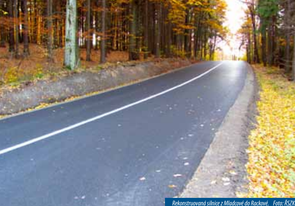
Rekonstruovaná silnice z Mladcové do Rackové.

Na stovky milionů korun přijdou každoročně v kraji investiční akce na rekonstrukcích či výstavbě nových mostů a silnic. Nemalé prostředky se do obnovy silniční sítě investovaly v letošním roce. Přinášíme malé ohlédnutí za nejdůležitějšími dokončenými investičními stavbami na silniční síti roku 2011.