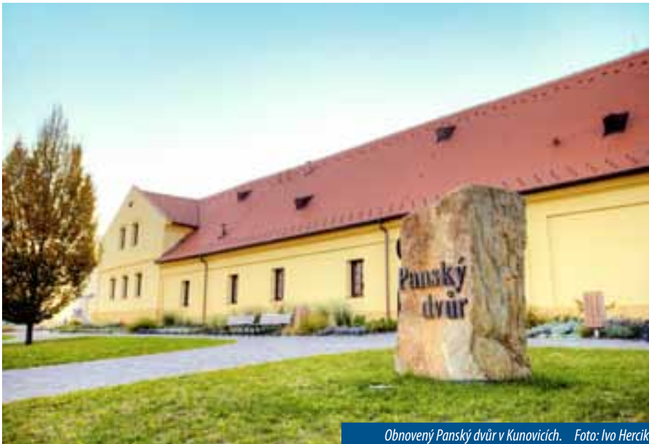
Obnovený Panský dvůr v Kunovicích.

Bělov – Výstavbu plavební komory u jezu Bělov a tím pádem i prodloužení splavnosti Baťova kanálu až do Kroměříže podpořili na svém jednání krajští radní. Vyhověli tak žádosti o vyjádření podpory, kterou jim adresovalo Sdružení obcí pro rozvoj Baťova kanálu a vodní cesty na řece Moravě. Jednou z priorit sdružení je právě prodloužení kanálu směrem na sever do Kroměříže prostřednictvím plavební komory na jezu Bělov. Prodloužení splavnosti kanálu by pomohlo cestovnímu ruchu v regionu. Na území Jihomoravského kraje se plánuje postavení plavební komory v Sudoměřicích na Hodonínsku. Obě stavby jsou zahrnuty mezi investiční záměry Ředitelství vodních cest ČR a nacházejí se ve vysokém stupni projekční přípravy.