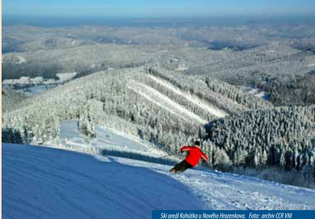
Ski areál Kohútka u Nového Hrozenkova.

Upravené sjezdovky a běžkařské tratě, zlepšené služby, široká nabídka ubytování, gastronomických lahůdek a relaxace – takto lze charakterizovat to nejdůležitější, co má pro zimní sezonu připraven turistický region Východní Morava. A ještě jedna dobrá zpráva – většina provozovatelů lyžařských areálů na území Zlínského kraje neplánuje zvyšovat ceny, přestože od ledna zasáhne celý sektor služeb změna sazeb DPH.