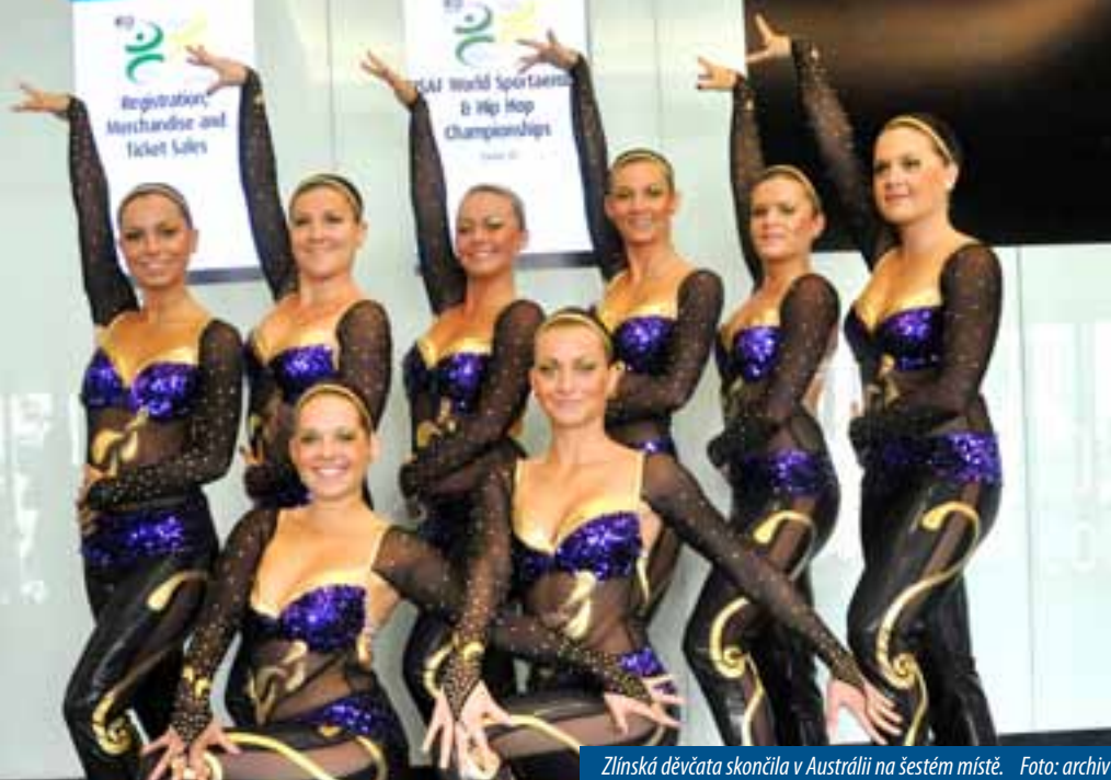
Zlínská děvčata skončila v Austrálii na šestém místě.

Buchlovice – Napínavou sérii závodů Hakman cup za sebou mají hráči Petanque klubu Stříbrné kule Buchlovice, kteří v říjnu už načali novou sezonu 2011-2012. Kdo by si myslel, že v zimních měsících hráči zalezou do tepla, je na omylu. Začátkem prosince je totiž čeká halový turnaj O pohár starosty města Uherské Hradiště a v lednu potom tradiční zimní venkovní turnaj Zmrzlé kule. Jde o pátý turnaj Hakman cupu.