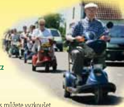
foto: naše prodejna Napajedla

Z našich nabídek vyberáme nejprodávanejší modely