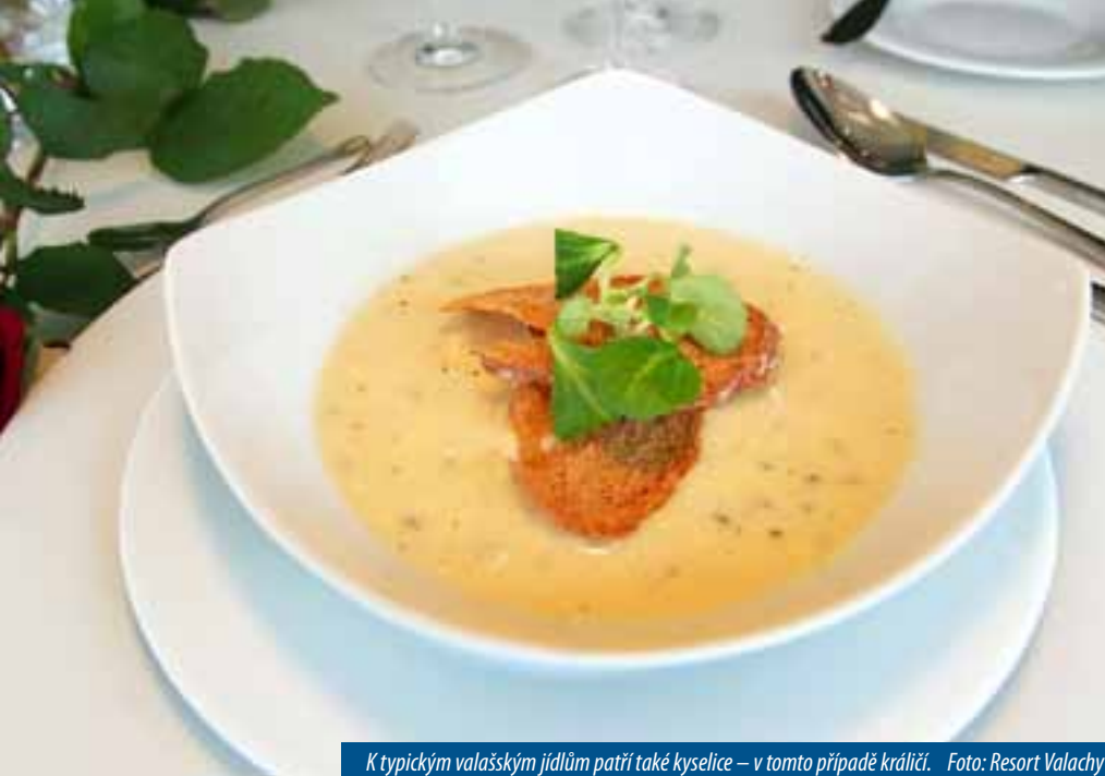
K typickým valašským jídlům patří také kyselice – v tomto případě králičí.

Gastronomie Východní Moravy je velmi pestrá díky vlivům Valašska, Slovácka, Hané, ale i nedalekého Slovenska. Odráží se v ní rozmanitost jednotlivých oblastí. Původní pokrmy jsou na Východní Moravě, zejména na Valašsku, historicky spojeny především s pohankou, která je i z dnešního pohledu obilninou budoucnosti a racionální výživy s léčebnými účinky. Hojně se používaly luštěniny, brambory, zelí a ovoce. Na Valašsku se dokonce říkávalo: „Zemáky a zelé, živobyty celé.“