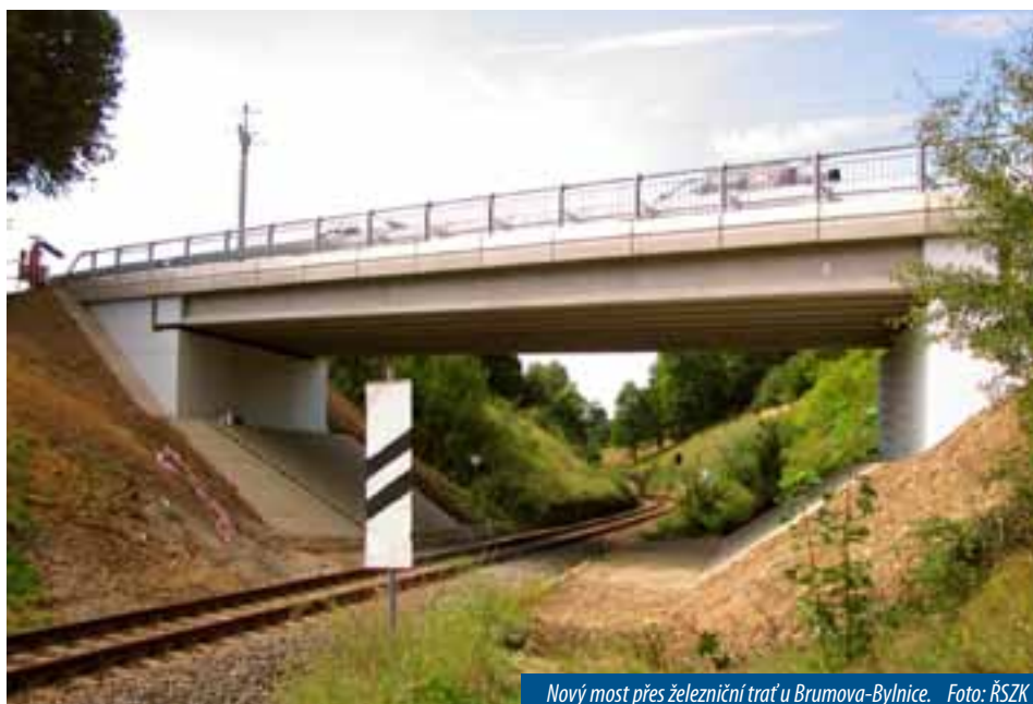
Nový most přes železniční trať u Brumova-Bylnice.