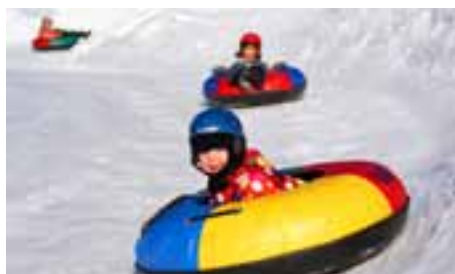
Snowtubing ve Velkých Karlovicích

Ski areál Synot Kyčerka nabízí výborné podmínky především pro rodinné lyžování. Novinkou letošního roku je rozšíření dětského parku o další dětský vlek a přemístění oblíbeného IGLÚ U ESKYMÁKA do areálu dětského parku, navíc se „lyžařská mimina“ mohou těšit na nové zajímavé programy. Hodně zábavy si užijete při vyjízdce šestimístnou sněžnou