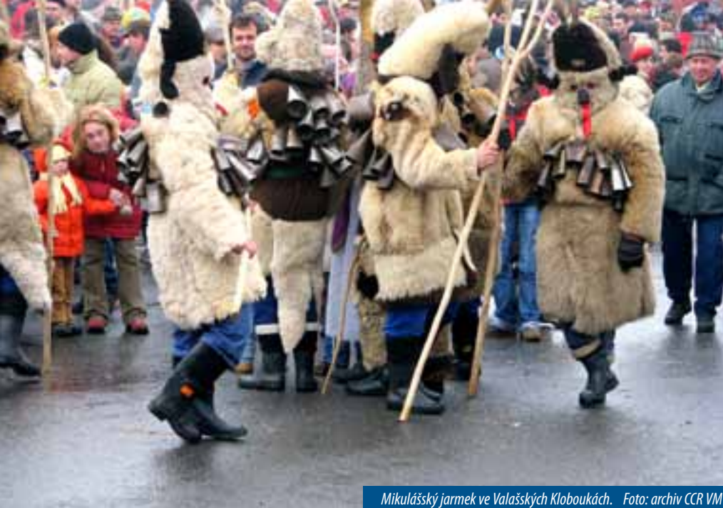
Mikulášský jarmek ve Valašských Kloboukách.

Prosinec – období, které mají rádi velcí i malí. Na co se můžete letos na Východní Moravě těšit? Čeká na vás řada tradičních akcí – jarmarků, zámeckých adventů, vánočních trhů a dílen, ale také atraktivní novinky.