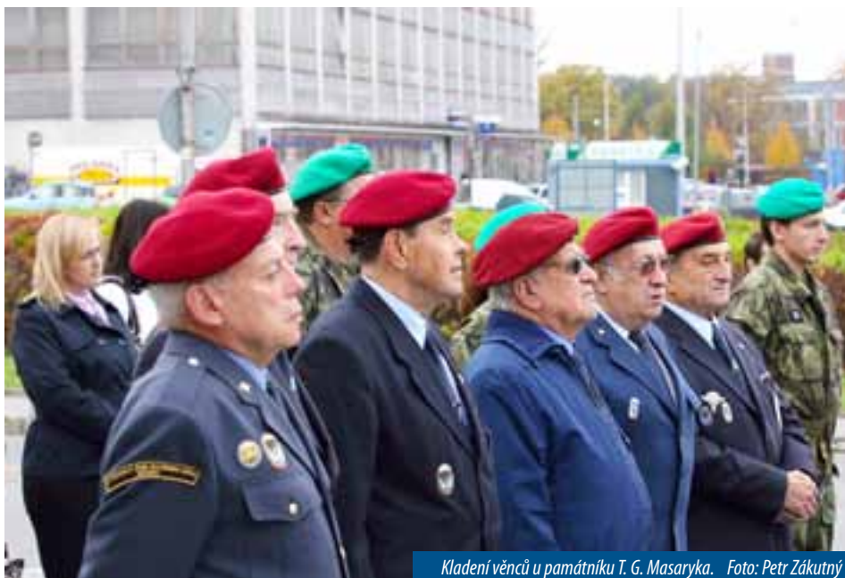
Kladení věnců u památníku T. G. Masaryka.

Požadavky na tato pracovní místa, včetně termínů uzávěrek, jsou uvedeny na internetových stránkách www.kr-zlinsky.cz/kariera .