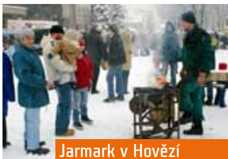
Jarmark v Hovězí