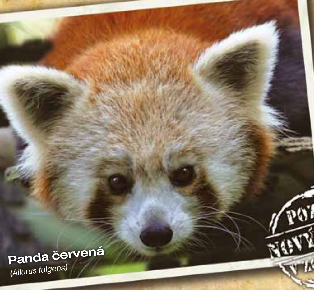
Panda červená (Ailurus fulgens)