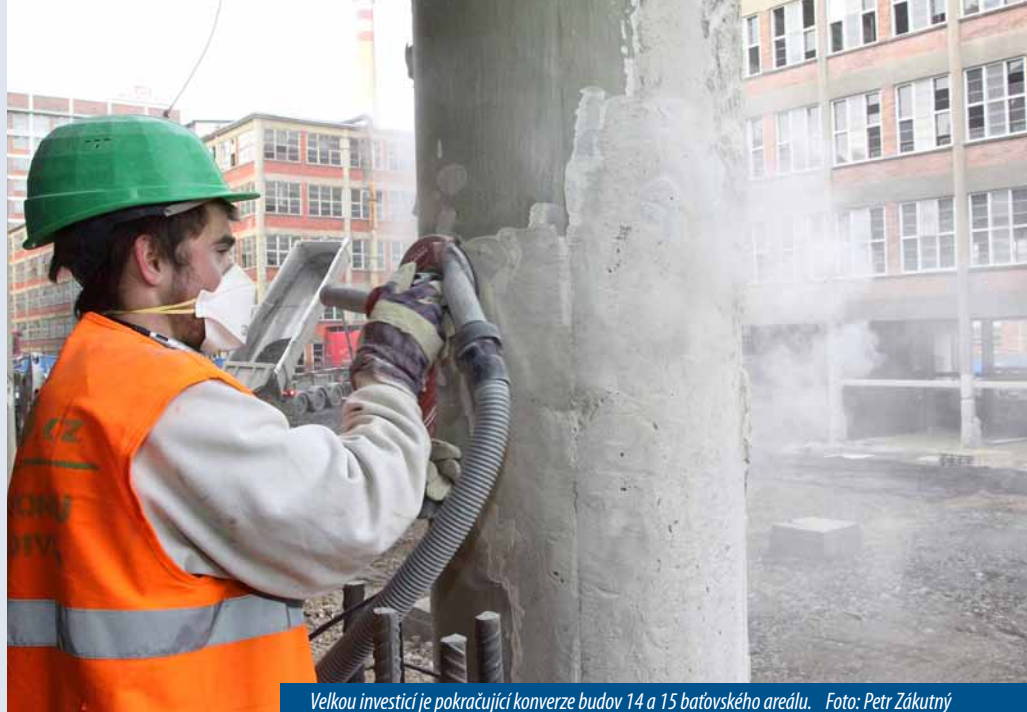
Velkou investicí je pokračující konverze budov 14 a 15 baťovského areálu. Foto: Petr Zákutný

Moderní hřiště na kroměřížské Střední odborné škole Tauferova, zateplená budova a výměnná okna ve zlínském Domově pro seniory Burešov, nové výjezdové stanoviště Zdravotnické záchranné služby v Uherském Hradišti či opravená Hvězdárna ve Valašském Meziříčí. To jsou příklady novinek, které nás v tomto roce čekají.