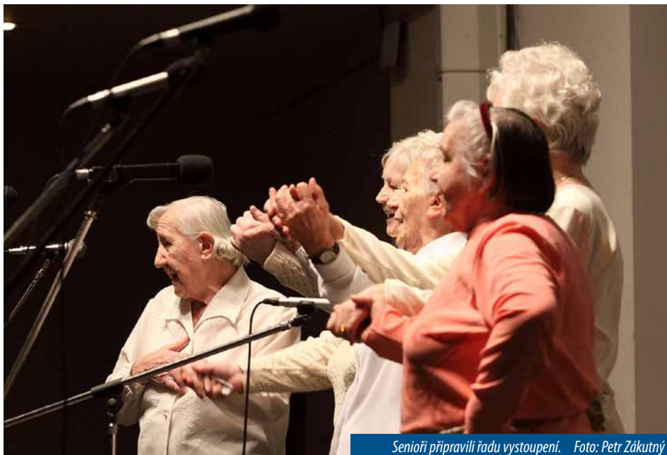
Senioři připravili řadu vystoupení.

Zlínský kraj – Rekordní počet návštěvníků, téměř 100 000, vstoupilo během sezony 2011 do 21 kostelů Zlínského kraje přihlášených do projektu Otevřené brány, aby využilo možnosti nechat na sebe mimo časy pravidelných bohoslužeb působit tato posvátná místa a něco se o nich dozvědět díky výkladu odborně vyškolených průvodců. Přesně je evidováno, že od května do září, kdy je v kostelích návštěvnícký režim s průvodem zajišťován, jej využilo 95 271 turistů všech věkových kategorií, z toho bylo 10 677 cizinců. Otevřené brány jsou zatím v České republice ojedinělým projektem Zlínského kraje, Arcibiskupství olomouckého a měst a obcí v regionu.