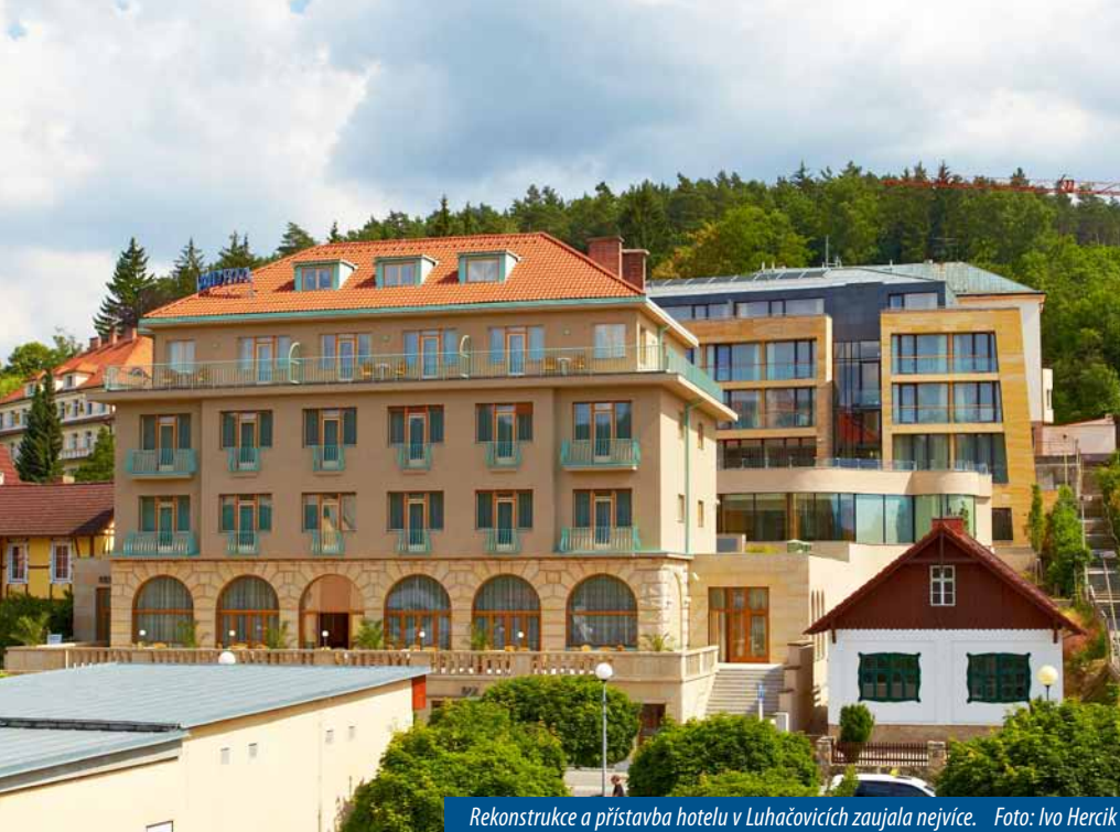
Rekonstrukce a přístavba hotelu v Luhačovicích zaujala nejvíce.