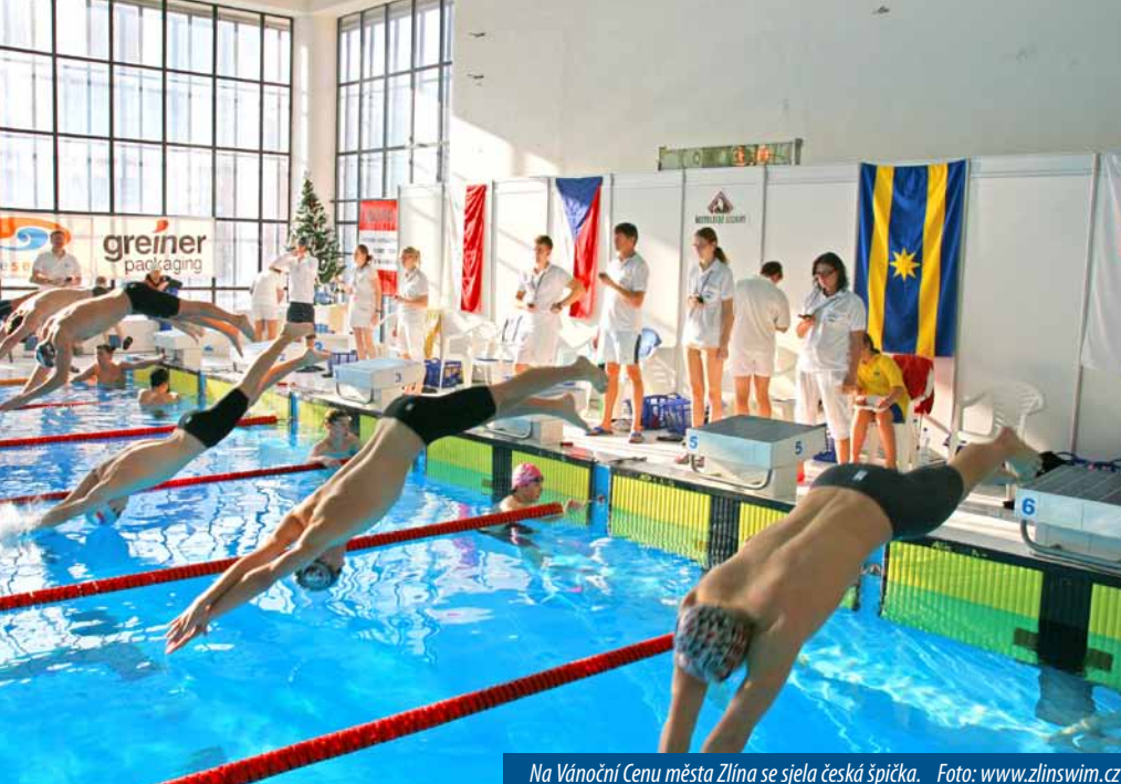
Na Vánoční Cenu města Zlína se sjela česká špička.