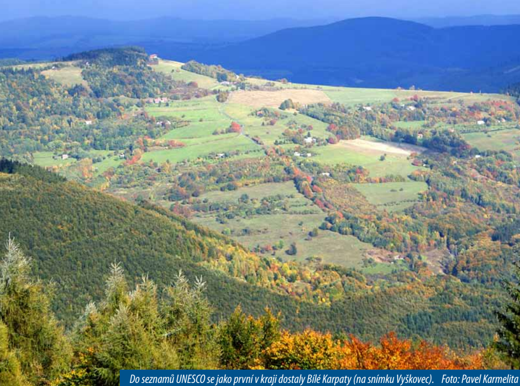
Do seznamů UNESCO se jako první v kraji dostaly Bílé Karpaty (na snímku Vyškovec).