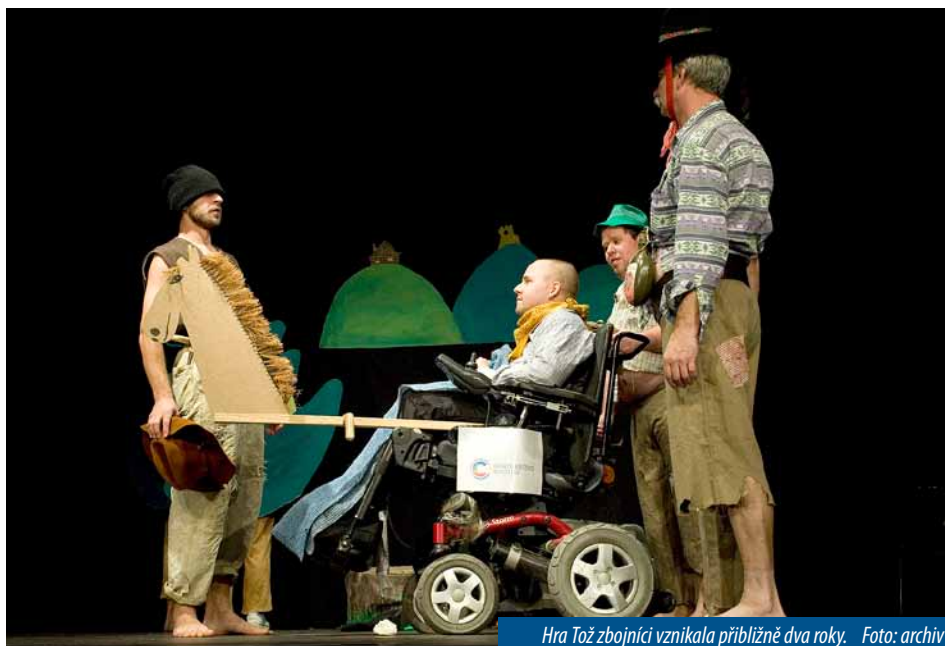
Hra Tož zbojníci vznikala přibližně dva roky.